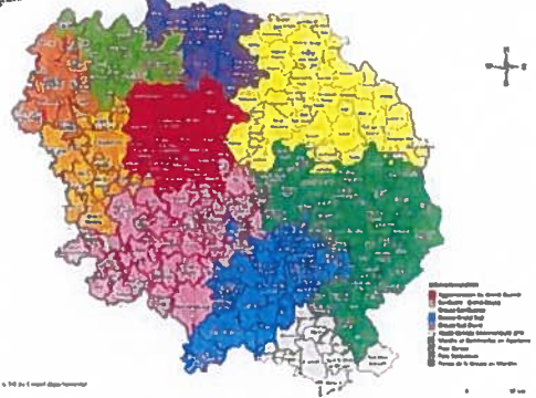
Les communes et Intercommunalités de Creuse en 2020

En 2023 et 2024, les 10 communautés de communes de Creuse ont adhéré à l'Agence pour soutenir le PAT pour la Creuse 26 communes sont actuellement accompagnées